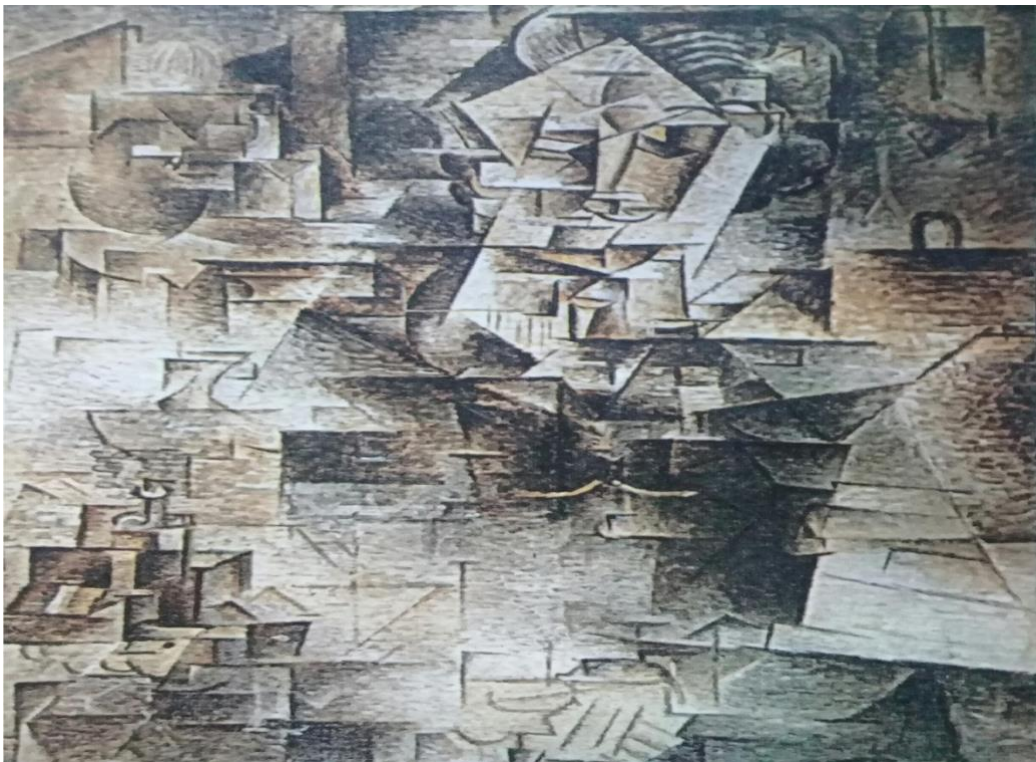
El guitarrista (1908). Pablo Picasso. Cubismo Analítico.

La segunda fase del cubismo se llamó sintético, porque los artistas reconstruyeron las formas por medio de los planos esenciales de sus lados, con lo cual lograron una síntesis del objeto que debían representar. Esta etapa utilizó mucho la técnica de COLLAGE.