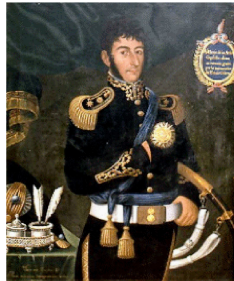
José de San Martín

Se han escrito ríos de tinta sobre José de San Martín. Entre todas esas obras es interesante la mirada de Bartolomé Mitre en Historia de San Martín y de la Emancipación Sudamericana , donde aclara y sintetiza: