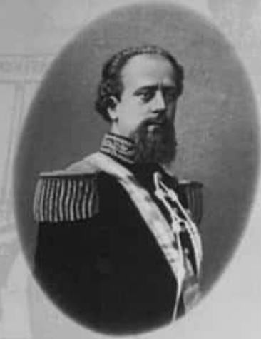
Durante la presidencia de Nicolás Avellaneda se llevó a cabo la Campaña al Desierto con el objetivo de incorporar nuevos territorios a la producción agrícola.