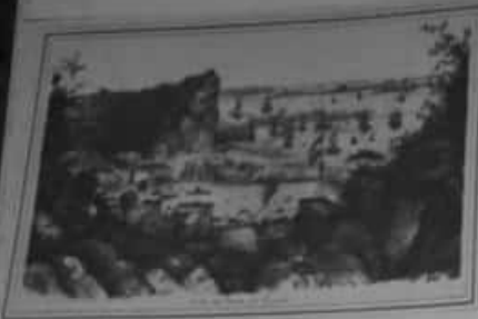
Vista del puerto de Paraná en 1858. En 1853, al convertirse en capital provisoria de la Confederación, Paraná tuvo un importante progreso y su población aumentó considerablemente.

Los fortines se crearon como puestos de avanzada para la ocupación de nuevos territorios habitados por tribus aborígenes.