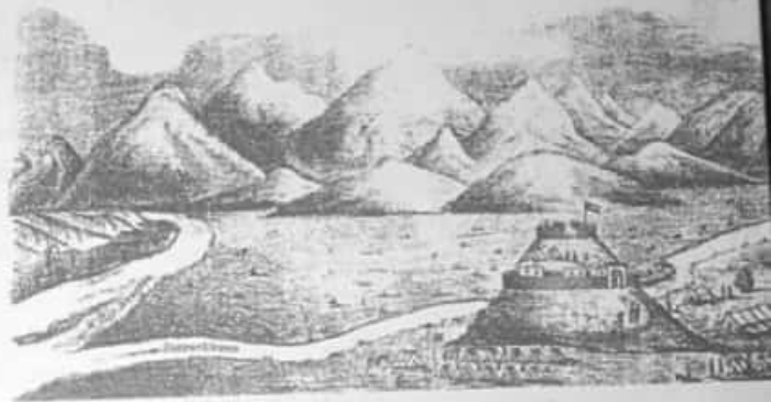
Diseño del fuerte correspondiente a la 4ª División de la Campaña al Desierto. Pertenece a la "Colección Geográfica" de Estanislao Zeballos y fue publicada en el Boletín del Instituto Geográfico Argentino N.º 2.