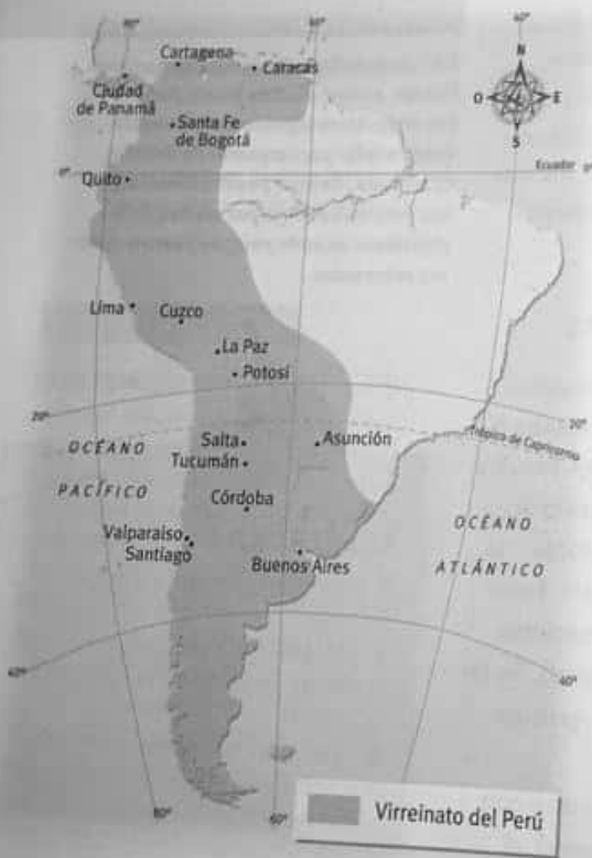
Desde la llegada de los españoles hasta la segunda mitad del siglo XVII, el actual territorio argentino se hallaba dentro de los límites del Virreinato del Perú.