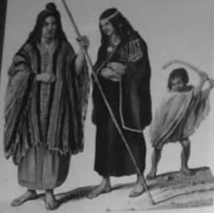
Los españoles no pudieron dominar a los araucanos; tuvieron que pactar con ellos y respetar su presencia.

Antes del arribo de los españoles, en el espacio que hoy constituye el territorio argentino habitaban diversos grupos aborígenes. Algunos hacían de la actividad agrícola su práctica económica fundamental, mientras que otros se dedicaban a la caza, la recolección, la pesca o el pastoreo. Algunos grupos eran sedentarios en distintas épocas del año, según los recursos naturales disponibles para satisfacer las necesidades de la comunidad. Las actividades económicas y las relaciones con otros grupos definían los ámbitos territoriales correspondientes a cada una de las comunidades.