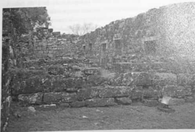
En la localidad de San Ignacio (Misiones) se conservan algunos de los edificios que conformaron las misiones jesuíticas asentadas en la zona. Constituyen hoy un patrimonio histórico de la humanidad.

Como los portugueses invadían frecuentemente las misiones en busca de mano de obra, los jesuitas decidieron armar a los indígenas allí establecidos. También trataron de evitar el contacto de estas poblaciones con habitantes coloniales, ya que consideraban que podían dificultar el proceso de evangelización. El mantenimiento del uso del guaraní, además de facilitar la acción de los religiosos, intensificó el aislamiento de las misiones. Hacia mediados del siglo XVIII, la Corona comenzó a ver en la autonomía y segregación de las misiones la posibilidad de que los jesuitas formaran un imperio independiente. Así en 1767, decidió expulsarlos de territorios coloniales. A partir de ese momento, las misiones perdieron población, y la producción en materia agrícola y textil disminuyó.