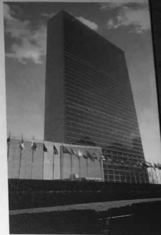
Edificio de la Organización de las Naciones Unidas, en la ciudad de Nueva York. Los organismos supranacionales están conformados por conjuntos de Estados nacionales. Aunque pueden tomar algunas determinaciones por encima de las decisiones de cada país, no pueden violar sus soberanías.

Para mejorar su situación económica y política, la Argentina, junto con Brasil, Uruguay y Paraguay conformó un órgano intergubernamental, el Mercado Común del Sur (Mercosur). En él, las decisiones las toman los gobiernos de los cuatro países. La formación del Mercosur ha afectado algunos de los rumbos de la política económica argentina en términos de aranceles aduaneros o de orientación de los flujos de exportación e importación.