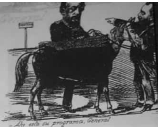
La asociación entre el general Roca y la frontera se hace elocuente en esta caricatura aparecida en la revista El Mosquito.

El intercambio a nivel económico se complementó con vínculos de carácter político. Muchas veces, los blancos intervinieron en los procesos de organización tribal al influir en la elección de caciques que resultaran favorables a los propios intereses. La caída de Rosas significó el fin de este tipo de vínculos y el retroceso del territorio ocupado por los blancos en la provincia de Buenos Aires hasta las márgenes del río Salado.