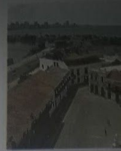
▲ Barrio histórico en Car Colombia.

Estos barrios carecen de una apropiada dotación de infraestructura de servicios y equipamientos. Por lo general, surgen en forma espontánea, sin planificación, y se localizan preferentemente en aquellos sectores de la ciudad donde los terrenos tienen valor más bajo, como los de la periferia o aquellos con problemas ambientales porque se inundan, o están cerca de ríos contaminados, etcétera.