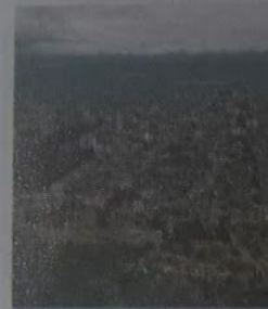
▲ Vista de la ciudad de S hacia la periferia.