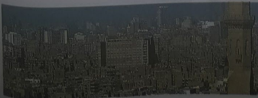
■ El Cairo es una de las c con mayor cantidad de encuentran grandes co calidad de la infraestructu barrios debido, en gran urbanización y la falta d