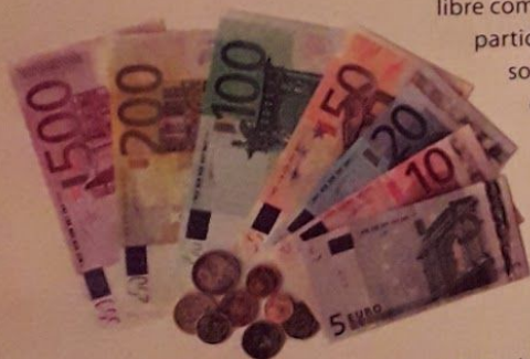
Billetes y monedas de euro. La moneda única de la Unión Europea fue puesta en circulación el 1° de enero de 1999.

Por último, una unión monetaria no solo requiere las tres condiciones anteriores, sino también que los países dejen de lado sus respectivas monedas y adopten una moneda única y común a todos ellos. De este modo, ninguno de los socios puede obtener ventajas comerciales reduciendo el valor de su moneda y, por ende, el precio de sus productos.