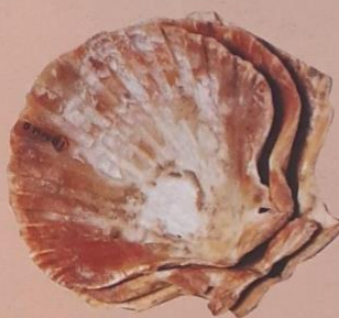
Ornamentos del Paleolítico superior.

Los cazadores del Paleolítico superior europeo empleaban gran cantidad de objetos a modo de adorno, como aros, collares y otros tipos de colgantes. Llevaban cosidas a sus ropas perlas, dientes perforados, pequeñas esculturas, caracoles y caparazones de crustáceos.