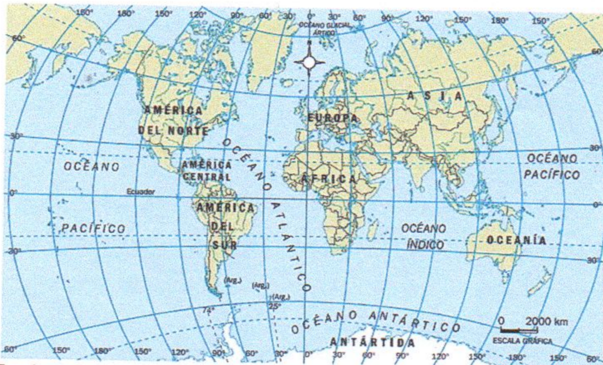
Espacios continentales y oceánicos del planeta

La Tierra es el tercer planeta del Sistema Solar en relación con el Sol. Tiene una forma esferoide o geoide (que significa "forma propia de la Tierra"), es decir, una esfera ligeramente ensanchada en el Ecuador y achatada por los polos. La superficie terrestre es de 510 101 000 km 2 .