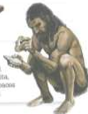
(FIG. 12) Mediante el choque o percusión de dos piedras, en general pedernal y pirita, se producían chispas, capaces de prender hierbas secas.

La utilización del fuego benefició a los humanos en muchos sentidos; les permitió calentarse y, gracias a su luz, pudieron realizar tareas nocturnas. Esto fue fundamental para la socialización; alrededor de las fogatas, los miembros del grupo compartían experiencias y establecían lazos de unidad. Por otra parte, el fuego servía para ahuyentar a los depredadores, como los osos de las cavernas o los tigres diente de sable.