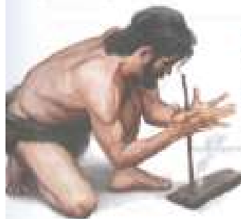
(FIG. 11) Uno de los métodos consistía en frotar un palo sobre otro. El calor provocado por la fricción generaba una brasa.

Al principio, los humanos aprovechaban el fuego que se había iniciado de manera natural, por un rayo caído durante una tormenta, o por la combustión espontánea de materiales en períodos de sequía y calor extremos. Durante esta etapa, los humanos aprendieron a conservarlo y transportarlo. Sin embargo, solo fueron capaces de prender fuego por sus propios medios hace 400.000 años. Las estrategias para ello consistían en la fricción (FIG. 11) y la percusión (FIG. 12).